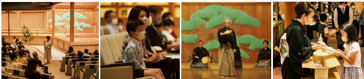
令和4年度 開講式より

「キッズ伝統芸能体験」とは・・・子供たちが一定期間にわたり、伝統芸能のプロの実演家から直接指導を受け、最後にその成果を本格的な舞台上で発表します。“本物体験”を通じて、日本人が大切にしてきた伝統文化への理解を深め、その心を次世代へ継承することを目的としています。